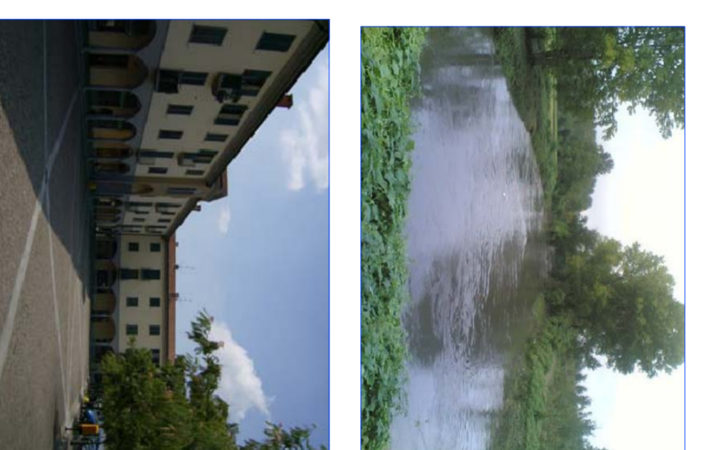
CLASSE II Frazione Lambro CLASSE III Piazza I Novembre 1872