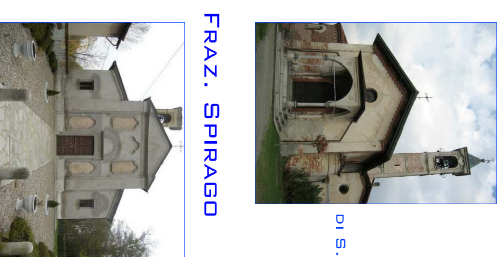
CLASSE II Chiesa Di S. Stefano Protomartire CLASSE III Chiesa